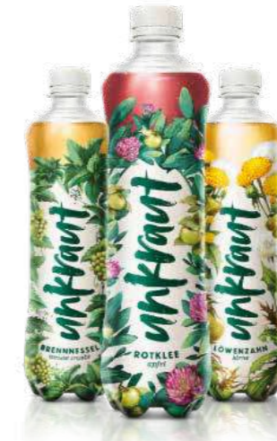
NAPURE AG, Mumpf