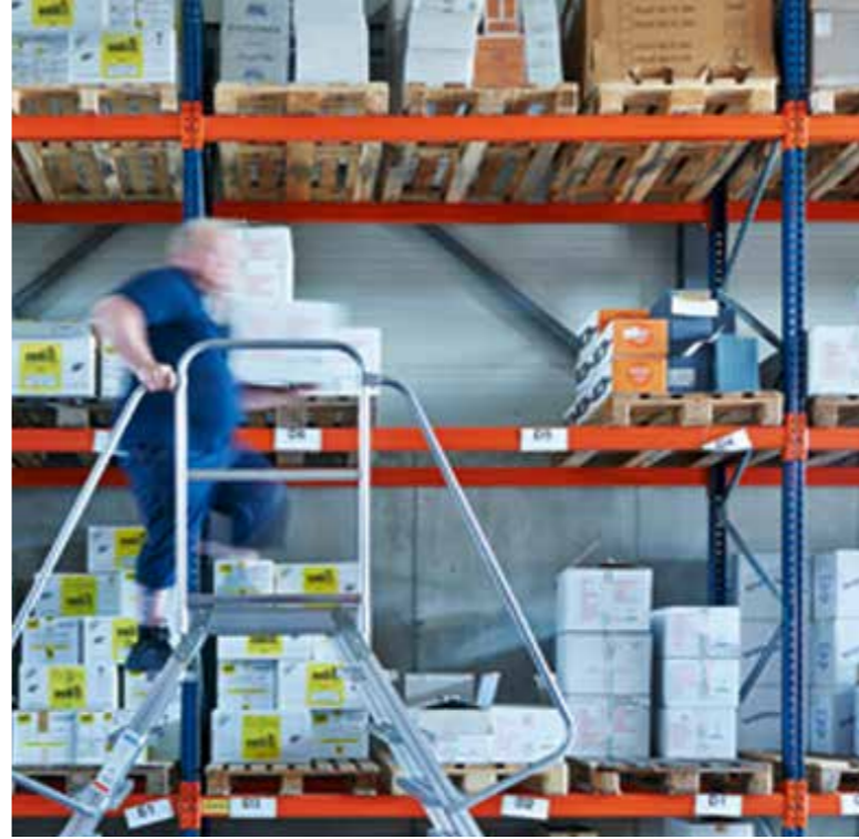
Freude bei der Arbeit

MODERNE FLURFÖRDERFAHRZEUGE ERMÖGLICHEN EINE RASCHE EIN- UND AUSLAGERUNG.