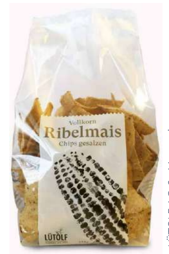
LÜTOLF AG, St. Margrethen